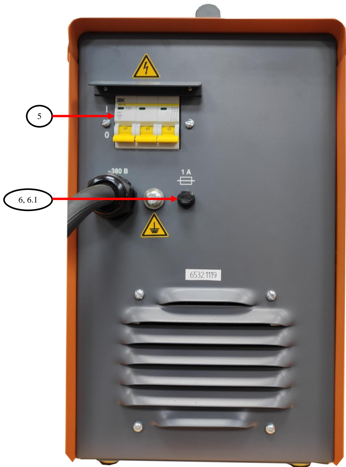
Рис.2 Задняя панель.