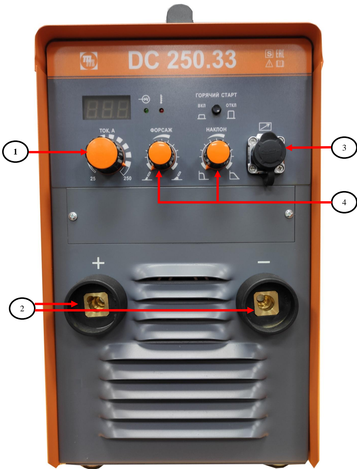
Рис.1 Передняя панель.